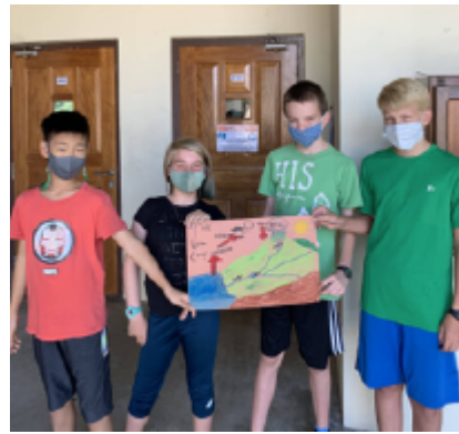
MAKING WATERCYCLE POSTERS MEMBUAT POSTER SIKLUS AIR